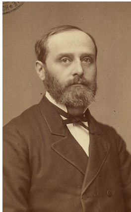
Friedrich Theodor Vischer

kirchlichen Positionen übte und sich zum Pantheismus bekannte, also zu der Auffassung, dass »Gott« eins mit der Natur und dem Kosmos sei, das »Göttliche« in allen Dingen existiere und mit der Welt identisch sei. Damit war allerdings auch eine Absage an einen »persönlichen Gott« verbunden. Vischers Vortrag wurde offenbar von seinen studentischen Zuhörern begeistert aufgenommen, stieß jedoch auf heftige Ablehnung bei den Pietisten,