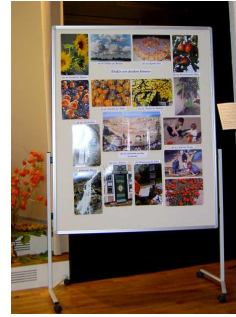
Templer- Dankfest 2008