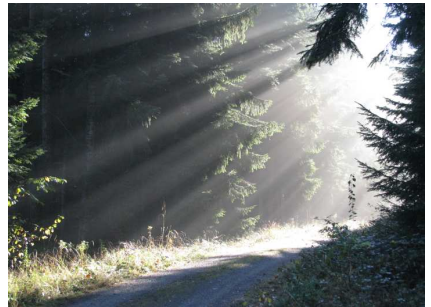
oben, links und unten: Gemeindefreizeit in Sulz-Bergfelden im Oktober mit Alt und Jung