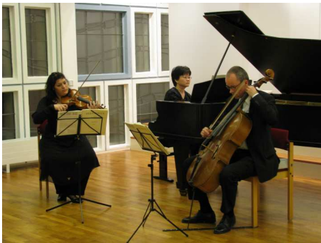
oben, links u. unten: Musikereignisse des Jahres im Gemeindesaal - Flöten-Ensemble, Trio Chagall, Quartetto Sonore