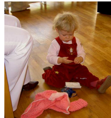
Leitwort: „Wofür wir danken können“