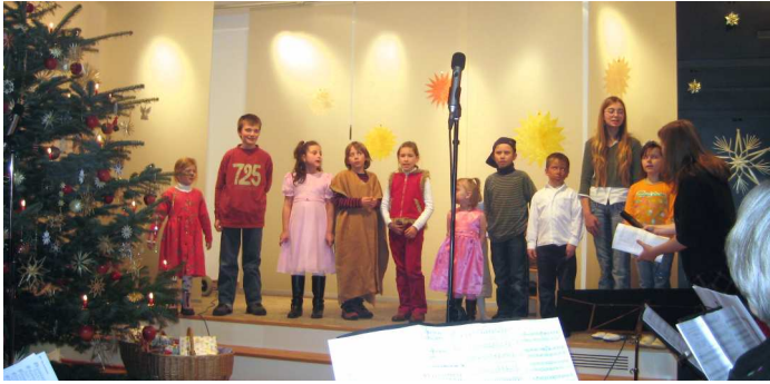
Gemeinde-Weihnachtsfeier 2007 – Szenisches Spiel der Kinder auf der neugestalteten Bühne des Gemeindesaals