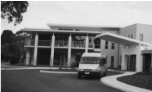
Ansicht des neuen zweistöckigen Otto-Löbert-Baus, rechts der überdachte Haupteingang des Alten- und Pflegeheims mit parkendem Spezialbus für Gehbehinderte

Im Alten- und Pflegeheim TTHA sind gegenwärtig 84 Bewohner untergebracht. Weitere 30 Personen wohnen in selbstbewirtschafteten Kleinwohnungen.